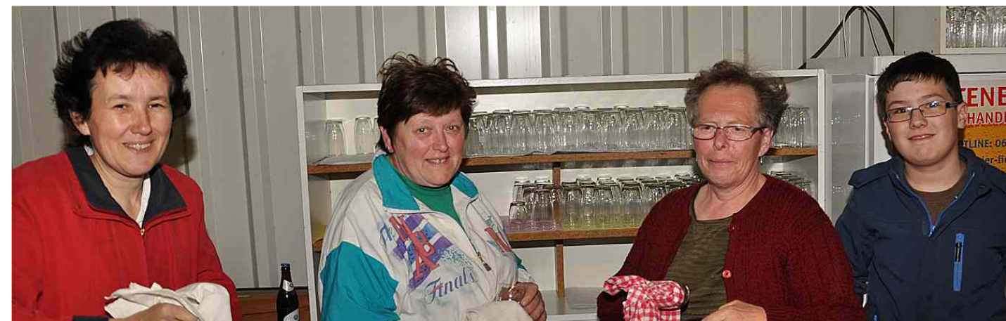
Das Pfingstfest in Tautendorf war echt gewaltig dank der vielen Helferinnen und Helfer – vor allem im Hintergrund der großartigen Veranstaltung. Was ein Dorf zu schaffen imstande ist, das zeigte Tautendorf.